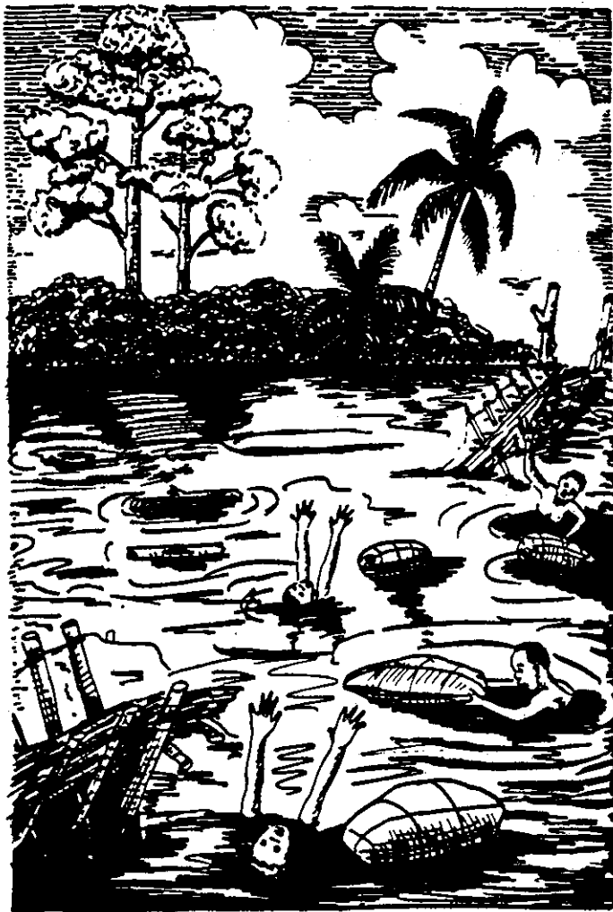
Omenukọ na ndị ibu ya wee daba na miri.

Journal atakere na ihe dị ka nkume juputara na miri ahụ nke mere ka miri ahụ na-aga ngwa ngwa, ngwa ngwa. Ọ buru na ihe ọ bula adaba na miri ahụ ọ ga-eburu ya n'otu mgbe ahụ bufuo. Madu agaghi enwekwa ya ọzọ. Site n'ihị ya, ihe nile Omenukọ nwere, bu ihe nile o jiri buru ogaranya wee gwusja n'otu ntabi anya ahụ. stopped 2/10/85