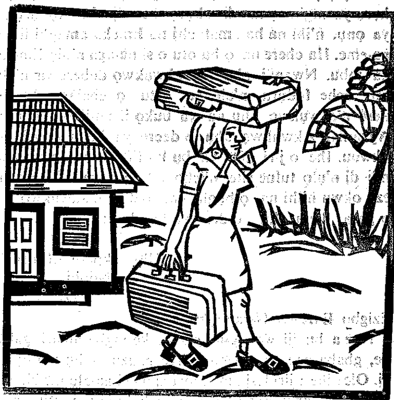
Nwanne ezi ya ihe mmuọ ji ntị oke eme.

ka nwanne zuba ya nri, n'ih i na ihe di n'enyi bu onye weta onye weta, ubochi ana aga. Ihe ahụ ekweghi ya edi. O wee kwaa akwa nke ukwu, daa n'ala gbue ikpere wee riowa ya ka o soro ya gaa. Mgbe o kwara akwa ahụ, nwoke ahụ wee cheta kwa udi mmadu oma Eme-ka buri na mbu. Omiiko wee mee ya. O wee gugua ya; si ya ya mata na mbu bu kpachara anya; nke ozo bu ru o bu kwa ihe m kaara gi akara. O kaara ya na ihe o