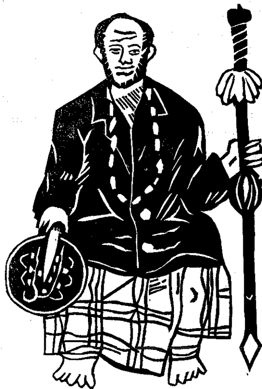
EZE ỌSUDO BỤ EZE EFULU

Ọnwụ Nwanne wepụsiri Emeka echichi ịla azụ nile di ya n'obi. Mgbe ihe ojọọ nile dakwasiri ya, ọ na-eche otu ya ga-esi mee wee bọọ Nwanne ọbọ ihe nile o mere ya. Ma ụgbu a, onye ọ na-akwadebere ngwa ọgụ alaala mmọ. O wee kwara ngwa ọgụ ya ghanye