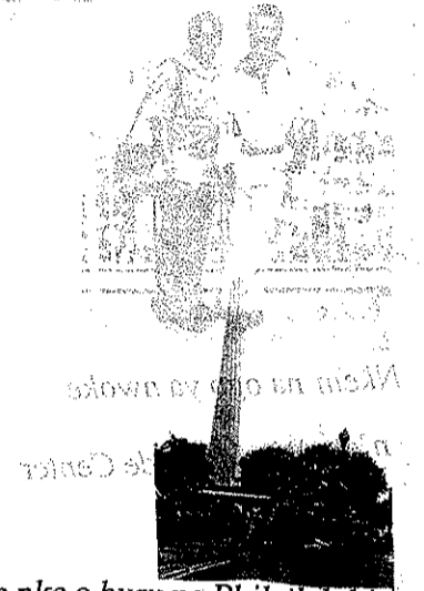
Nkem nokwa na nleghani anya ne-ele statue nke o huru na Philadelphia.