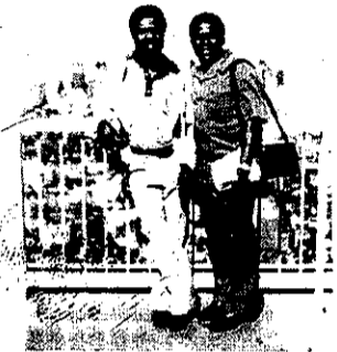
Nkem na ogo ya nwoke n'elu World Trade Center