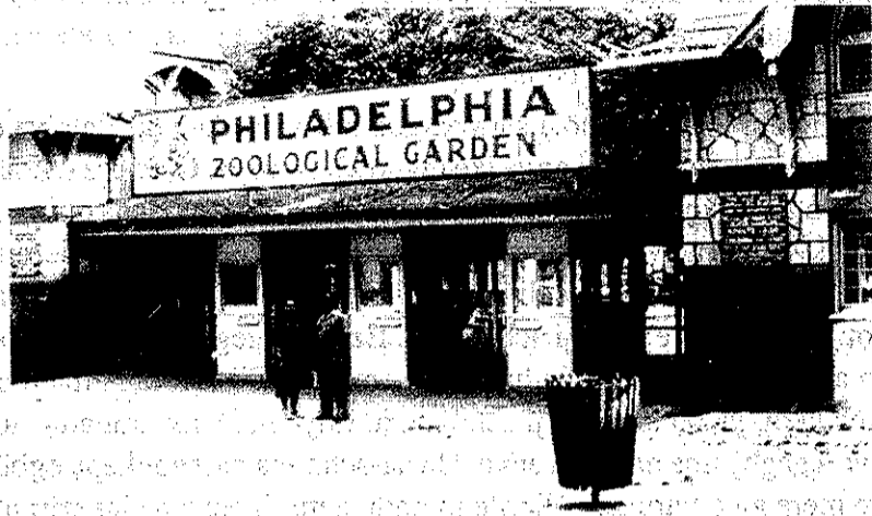
Nkem na nwanyi nwanne ya no na zuu nke Philadelphia

Na Steti nke a ka m bi ebi mgbe gara njema. Ya bu obodo na-ekpo ezigbo oku oge okpomoku nke mere na m nwere ike mgbe ufodu yiri naani singleti nodu mu na umuaka ana-agba boolu na-atakasi eze. N'ututu ufodu m na-amaputakwanu n'ura wee mee ihe ha na-akpo 'joging' oso ututu iji-wee mee ka afo m na-achọ ibuwe ibu n'ihu oke nri oma na ihe onunu m na-ekpori mgbe ahụ belata.