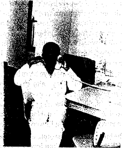
Nkem na-aza telefonnu

Mana ebe ihe oma di ebe ahụ ka ihe ojoo dikwa. Oge ufodu ha nesi na foonu amara ebe onye ha chooro inweta ma gbuo ya nno o. Oge ufodu ha na-esi na foonu emenye mmadu ha choro egwu. Kama na ihe oma ha ji foonu eme kariji ihe ojoo ha ji ya eme. Mgbe ode akwukwo na-agaghari na-azu ihe n'otutu shopu o mesiri chefuo akpa ya n'otu n'ime ha. O bu site na foonu ka o si chota ya ma juta ulo ahia ebe akpa ha ahụ o chefuru no kpom kwem. Nke a mere otutu mgbaghari n'ugbo ala na ije be mmadu o noghi ya adikebeghi n'ihia na tutu mmadu ejee be ibe ya o na-ebukari uzo kpo na foonu mara ma onye ahụ o no n'ulo. Oru ha ji foonu aru ebuka.