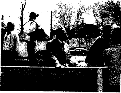
Nkem akpagharia n'elu inyinya