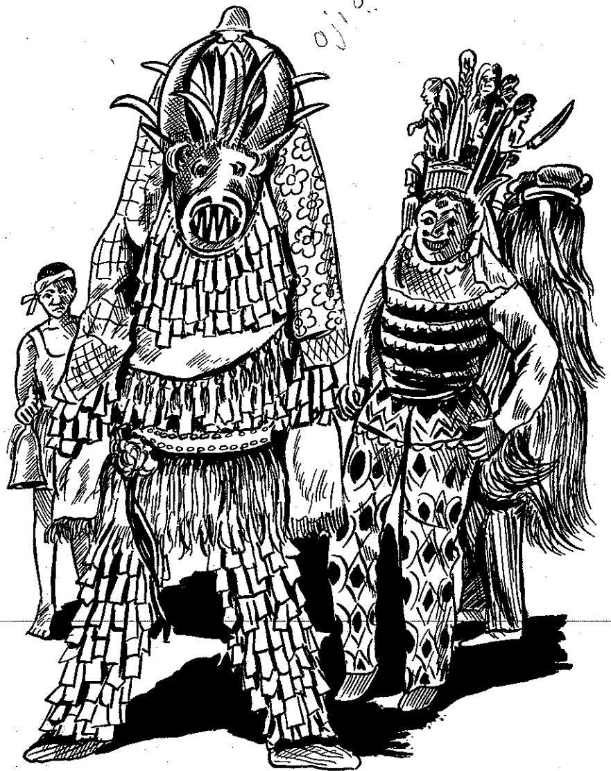
Mmanwu dị iche iche n'ala Igbo.