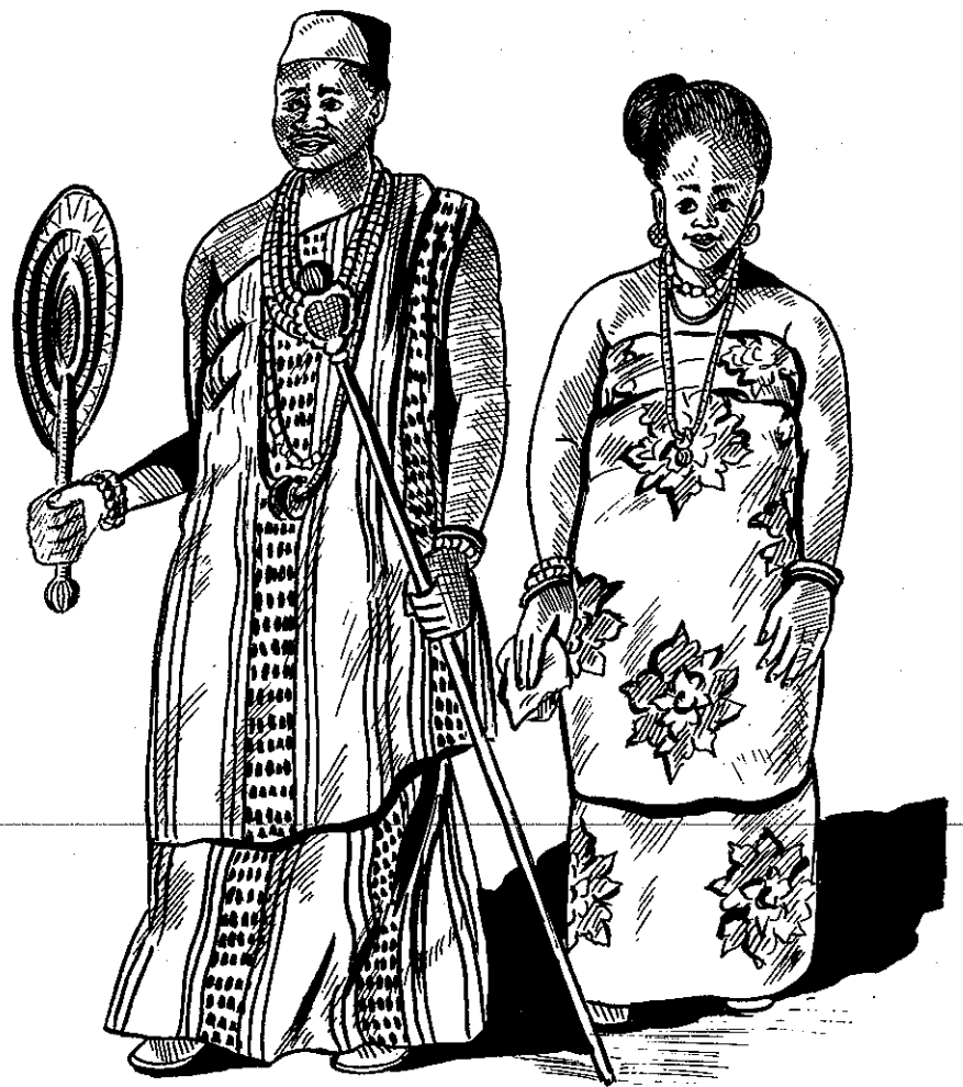
Onye chiri ọzọ na oriakụ ya.